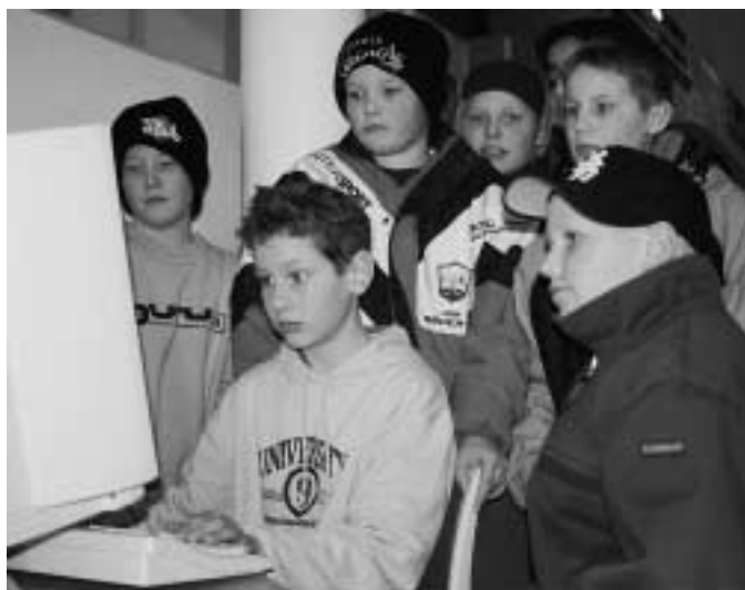
(Personene på bildet har ingen forbindelse med forhold beskrevet i artikkelen.)

Det har vore slik over fleire år, så dei har ei svært velfungerande bibliotekteneste. Noko av det som blir sett mest pris på blant lånarane er at dei legg vekt på personleg service. Om ikkje det er slik at bøkene nesten blir levert på døra til kvar enkelt lånar, så er det likevel slik at "Boken kommer"-tenesta er svært velutbygd. Det er eit tilbod som dei fleste institusjonar tek i bruk. Biblioteket legg dessutan vekt på at dei skal vere ein stad