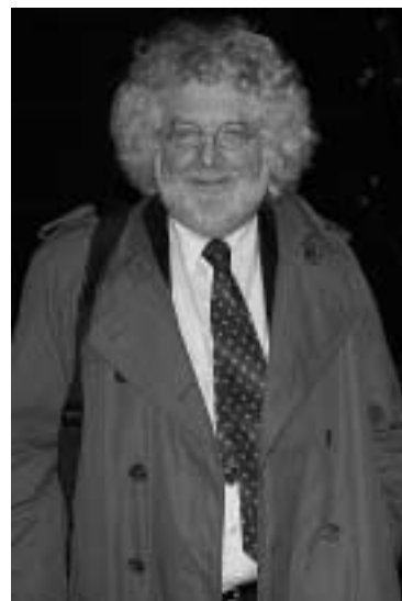
Edvard Hoem sto for bibliotekmøtets dikteriske perle.