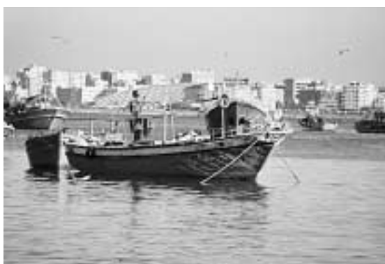
Alexandria har hatt mye kontakt med verden rundt seg opp gjennom historia. Nå søker også norske bibliotekstudenter til byen med det berømte biblioteket.