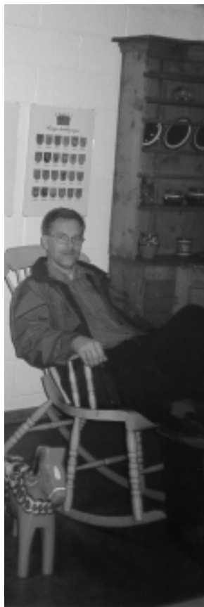
Artikkelforfatteren i Rättvik biblioteks lokal-samling.

Biblioteket er det mest besøkte i Sverige - alle vil komme å lære - men det er neppe mulig å kopiere dette. Dette handler om rett person på rett sted til riktig tid! Folk hadde ikke mye å klage over, men før biblioteket åpnet snakket jeg med en eldre mann som var klar i sin tale: «Biblioteket är mycket bra, men läshörnan är Sveriges sämste!». Den var alt for liten og her måtte en nesten be om unnskyldning for å brette ut «Sydsvenska Dagbladet». På grunn av den utrolige satsingen betyr dette at biblioteket blir en attraktiv partner og dette krever motprestasjoner. Biblioteket hadde 20 tilsatte og dette var det samme som før IT-satsingen. Disse var fordelt i såkalte arbeidslag, «Bam», «Media Data» og «Särskild service». Personalet må derfor være fleksible (det jeg gjør i dag gjør jeg ikke i morgen!). Det fantes også motkrefter blant personalet - det skulle