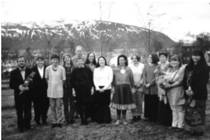
Troms BF har fått en bibliotekarutdanning i nedslagsfeltet sitt. Her avgangskullet sommeren 1998.

I år ble de første studentene fra bibliotekarutdanningen i Tromsø ferdige. Av disse 5 har 3 fått jobb i Finnmark og 2 i Troms. Dette er svært gledelig, og er et godt eksempel på at det er lettere å beholde fagfolk i landsdelen om utdanningsinstitusjonen finnes her. Når byer som Harstad og Tromsø sliter med å få kvalifiserte søkere til ledige stillinger, er det