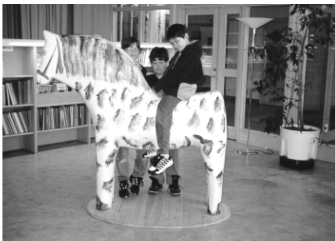
Barneavdelingen i Ljusdal bibliotek

Kulturhuset har fellesfunksjoner som gjensidig styrker møteplassen. Biblioteket var kommunal storstue, inndelt i mange små rom. Flere av rommene var preget av stedets kulturarv og historie. Kanskje har dette sammenheng med at biblioteket hadde status og at innbyggerne hadde et eierforhold. Dalarna og Siljanområdet er Sveriges nasjonale navle. I lokalsamling var det skatoller og dalahester, i «läshörnan» var det kakelovner og husflidsmateriale og i musikkavdelingen ulike musikkinstrumenter. Hele biblioteket ga et hjemmekoselig preg. Bibliote-