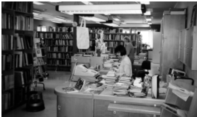
Interiør fra Sunne bibliotek i Värmland.

De har hatt et utall forslag til nye biblioteklokaler siden 1968, men problemet er at ingen politiske partier har villet satse på det. Alle synes at biblioteket er viktig, men som hun sier «når det