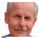
TEKST OG FOTO Erling Bergan Redaktør

Hun tar tak i lønnsforhandlingene, hun engasjerer seg i problematiske arbeidsforhold og tar gjerne en diskusjon om organisasjonsmodellen for biblioteket i den fusjonerte kommunen er god. Men samtidig styrer hun unna konflikter. – Jeg gjør som regel som jeg blir bedt om, sier BFs tillitsvalgte i Asker.