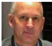
TEKST Roar Hagen BF Forsikring

FORSIKRING ▴ Sommeren er høysesong for reiseskader. Forsikrings-selskapet Tryg får inn ca. 40 prosent flere saker i sommermånedene. Selskapet opplever at mange ikke har satt seg godt nok inn i hva de kan få dekket og hvilken hjelp de kan få med reiseforsikring. Her er 4 ting du bør vite før du legger ut på tur.