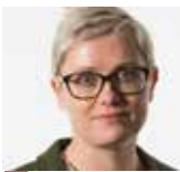
TEKST Monica Roos KnowledgeArc

Myanmar er i ferd med å åpne seg opp, på mange måter. Et lukket land med en trøblete fortid ønsker å endre kurs.