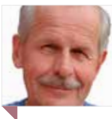
TEKST OG FOTO Erling Bergan Redaktør

– Jeg skulle ønske at ansatte i større grad var med på å bestemme hva slags kompetanse vi egentlig trenger når en stilling blir ledig. Som fagforening kommer vi ofte inn på slutten av prosessen, og da kan det være for sent å markere uenighet. De lokale tillitsvalgte burde være med fra starten av prosessen for å sikre at de ansatte stiller seg bak utlysninga.