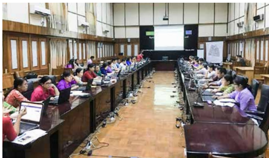
UNIVERSITETET I YANGON: EIFL samarbeider om et open access-prosjekt med universitetene i Mandalay, Yadanabon og Yangon.