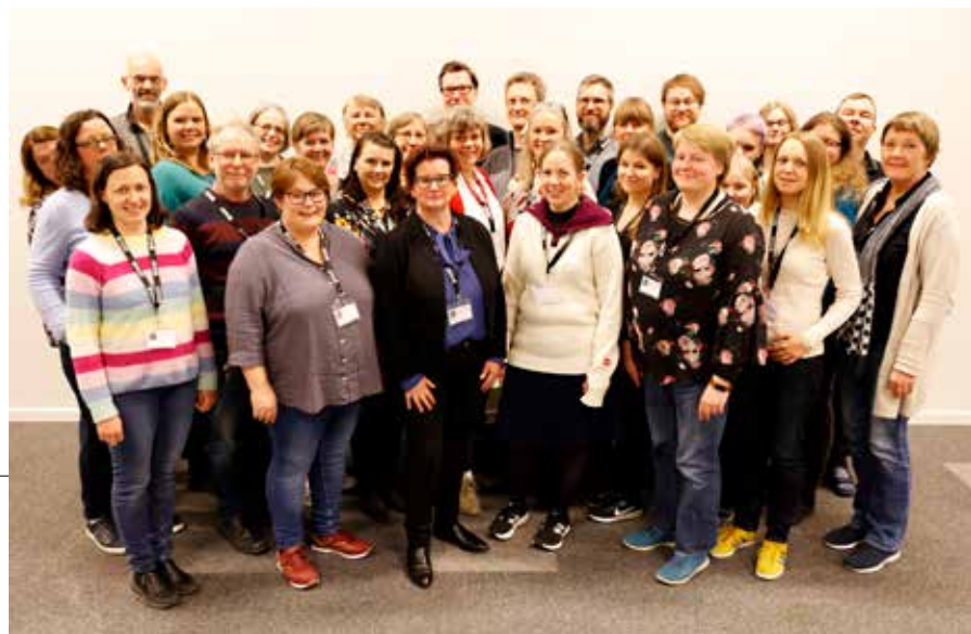
FYLKESLAGSSAMLING: Deltakerne samlet under årets treff i Lillestrøm.

Som ledd i arbeidet med å utrede medlemskriteriene laget deltakerne på samlingen en SWOT-analyse rundt medlemskriteriene. En SWOT-analyse er et planleggingsverktøy som brukes for å vurdere styrker, svakheter, muligheter og trusler. Problemstillingen som deltakerne jobbet med var å kartlegge konsekvensene av en mulig endring fra dagens krav om 60 studiepoeng til ytterligere åpning av medlemskriteriene. SWOT-analysen er et av flere elementer i konsekvensanalysen forbundsstyret jobber med. På bibforb.no er det laget en egen inngang for medlemskriterier vi håper skal være et godt hjelpemiddel for å belyse alle sider av saken. Resultatet av SWOTen vil bli presentert på landsstyremøtet til høsten. ▼