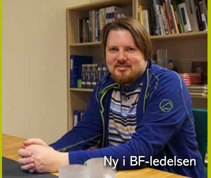
Ny i BF-ledelsen