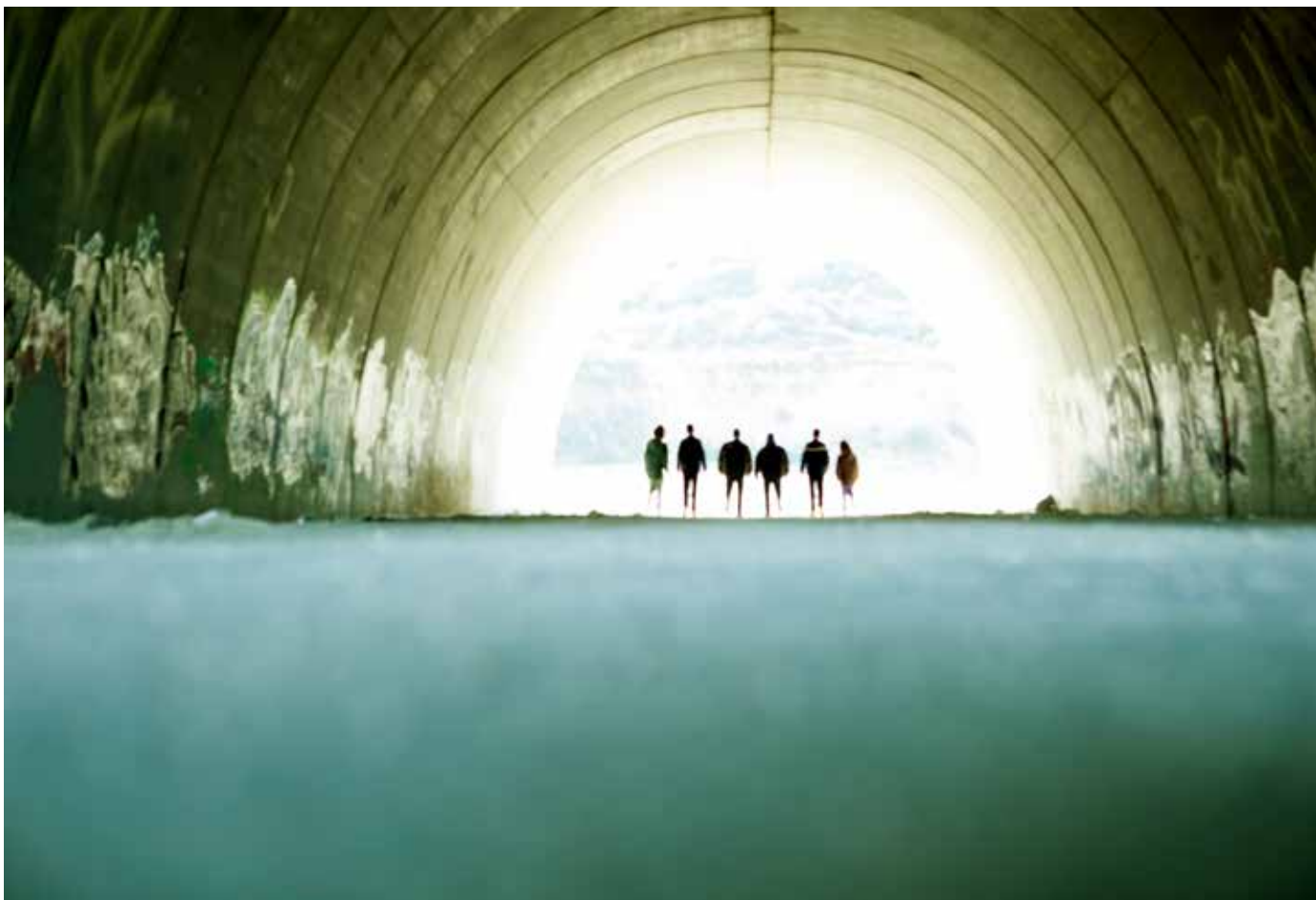
Forslagene fra Oslo og Hordaland kan gi BF det samme faglige fellesskapet som mange allerede opplever på egen arbeidsplass. – Selv om kompetansen blant de ansatte på et bibliotek er ulik, er arbeidsvilkårene som oftest like og interessene sammenfallende, skriver Oslo BF i sin begrunnelse.

det i mange stillinger fortsatt vil være nødvendig med bibliotekfaglig personale, men vi anerkjenner at det i noen stillinger er behov for andre kompetanser.