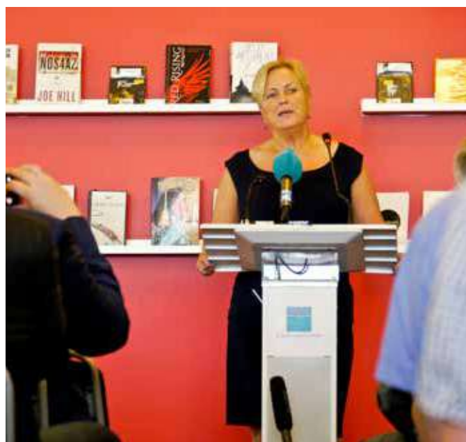
Daværende kulturminister Torhild Widvey kom 12. august 2015 til Drammensbiblioteket for å presentere nasjonal bibliotekstrategi, i betydningen "statens oppgaver og ansvar". Var BF for positive til planen?

Et poeng her kan være at strategien hadde undertittelen «Statens oppgaver og ansvar for utvikling av folkebibliotekene» og derfor må regnes som vesentlig mer begrenset enn hovedtittelen «Nasjonal bibliotekstrategi» skulle tilsi. Var BF for positive til daværende kulturminister Torhild Widvey og nasjonalbibliotekar Aslak Sira Myhre?