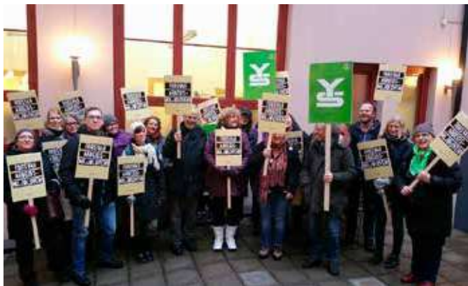
Et godt knippe med BF-medlemmer samlet før den store demonstrasjonen til forsvar for arbeidsmiljøloven i januar 2015. Har arbeidslivet hardnet til slik vi fryktet?

Stortinget vedtok endringer i arbeidsmiljøloven, gjeldende fra 1. juli 2015. Blant annet er det nå tillatt med midlertidig ansettelse på inntil 12 måneder.