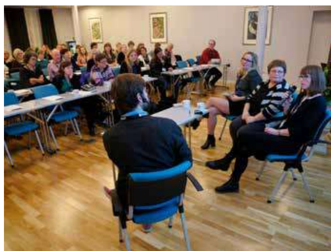
To tillitsvalgtkonferanser er arrangert i landsmøteperioden. De koster en god del, og de oppsummeres som vellykkede i beretninga, som sier at de bør arrangeres hvert år det ikke er landsmøte. Enig?

Et poeng her er at BF bruker mye ressurser på tillitsvalgtkonferansene og at tilbakemeldingene kommer fra de som har vært deltakere. Er øvrige medlemmer tjent med denne satsinga?