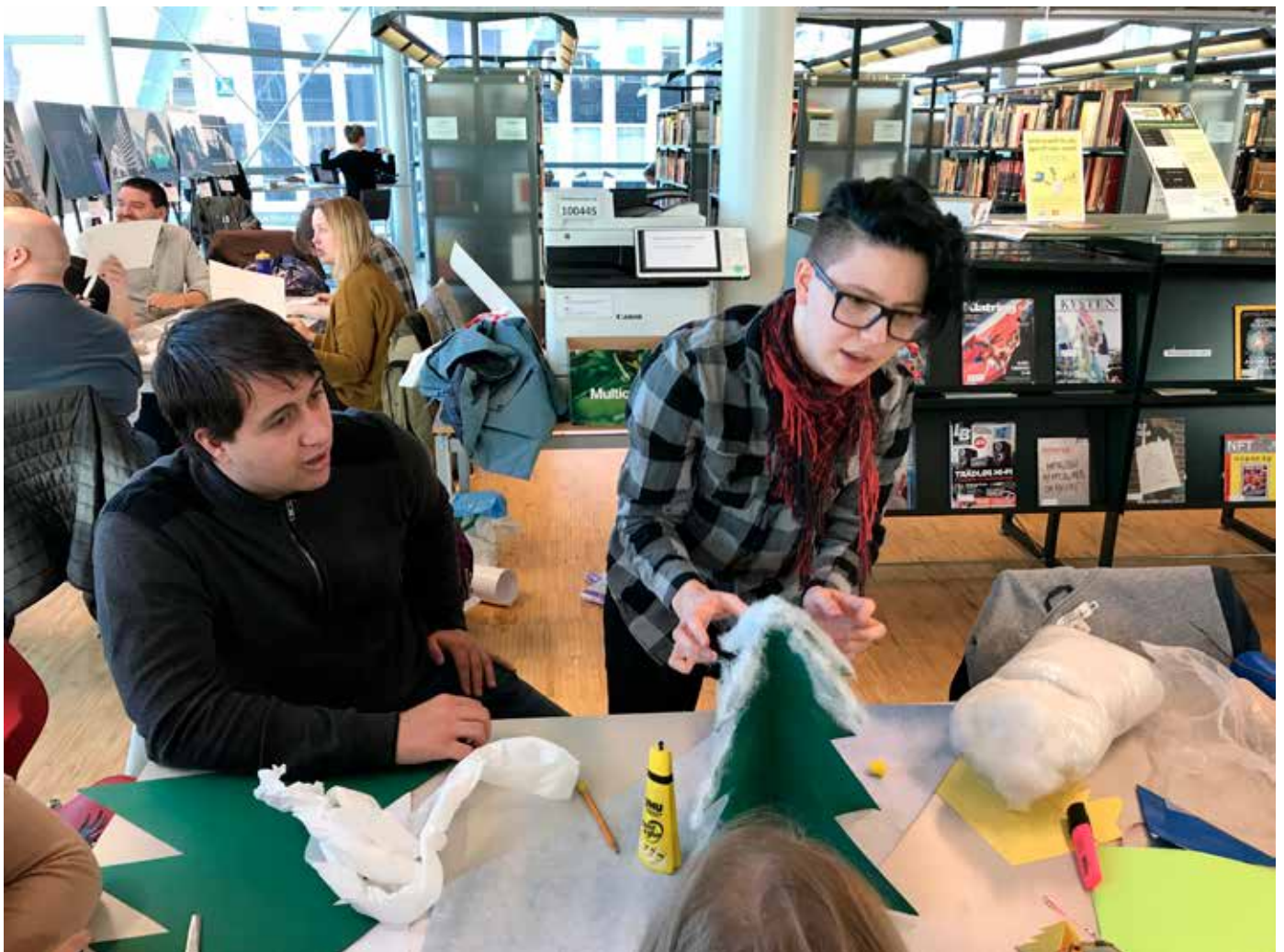
Studenter fra "Bibliotek og formidling"-emnet ved UiT Norges arktiske universitet i gang med å lage utstilling på Tromsø bibliotek.

Resultatet har blitt noen flotte utstillinger til barne- og ungdomsavdelingen og til voksenavdelinga. Utstillingene skal stå til slutten av oktober. Både de ansatte på Tromsø bibliotek, undervisere på emnet og ikke minst studentene har lært mye i denne prosessen. I tillegg har det vært veldig sosialt, og studentene har blitt kjent med hverandre på litt andre og nye måter enn i den tradisjonelle undervisningen med gruppearbeid. Vi håper derfor at vi også i årene fremover kan fortsette de gode samarbeid med Tromsø bibliotek, der vi slipper studentene til i det virkelige livet! ■